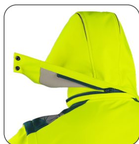
odepínací kapuce odnímateľná kapučňa detachable hood odpinany kaptur