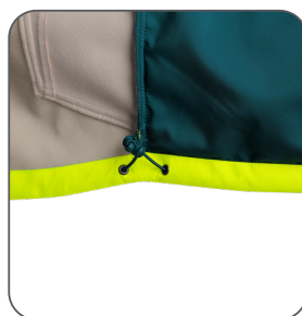
stahování v dolním okraji stahovacia šnúrka na spodnom okraji tightening at the bottom ściągacz w brzegu dolnym