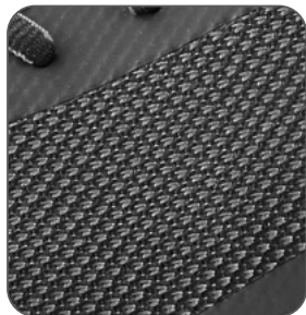
prodyšný svršek priedušný zvršok breathable upper oddychajúca cholewka