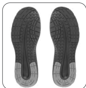
podešev podošva outsole podeszwa